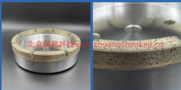
碗轮 Bowl wheel