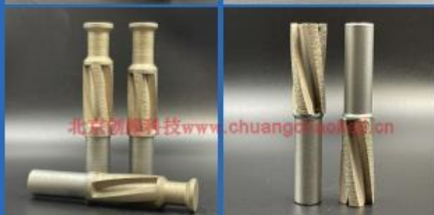
G1/2" wear-free copper drill bit