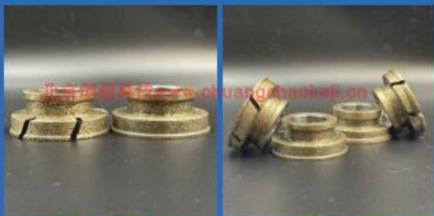
鱼缸台阶轮 Fish tank step wheel