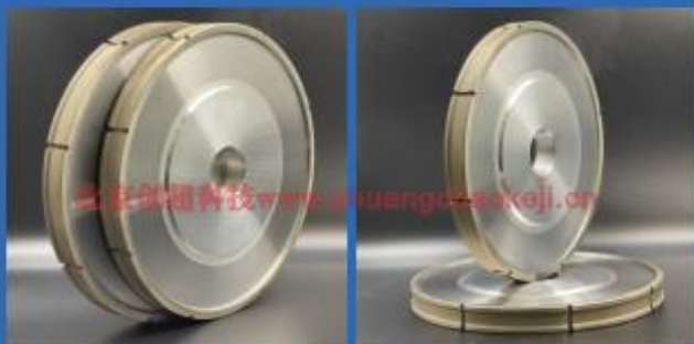
CNC专用磨轮 CNC special grinding wheel